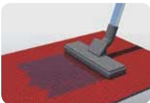
Regelmäßig mit Sprühextraktion-Methode reinigen