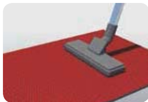
Tägliches Absaugen mit dem Staubsauger