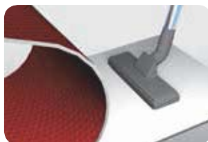
Wöchentliches Absaugen unter der Matte