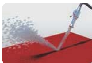
Gelegentlich mit Wasserdruck und Seife reinigen

Achtung: Wenn die Ränder brüchig oder wellig werden, sollte die Matte nicht mehr eingesetzt werden bis die Stolpergefahr beseitigt ist.